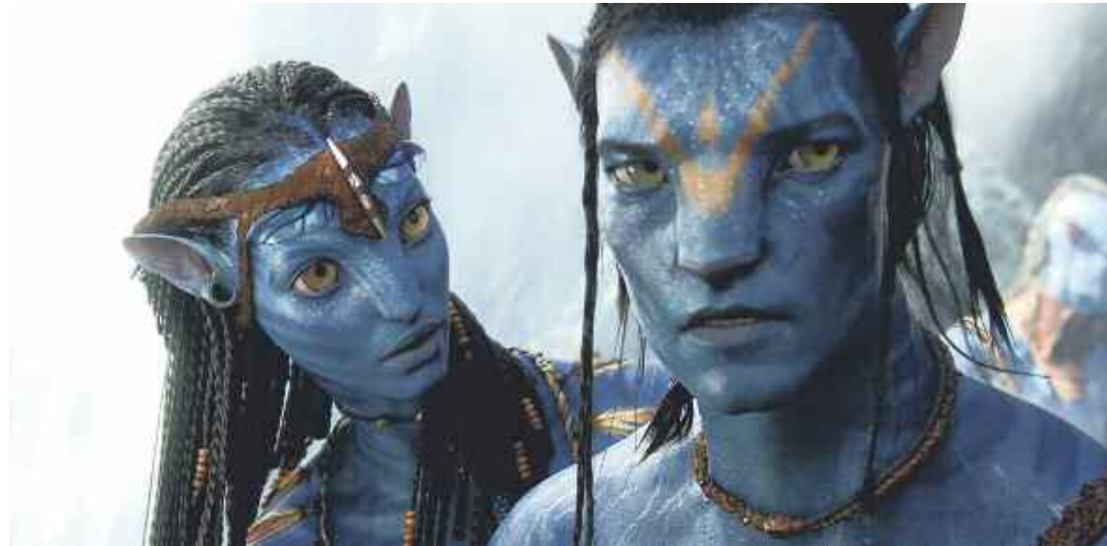
Avatar, de meest winstgevende film ooit, leidt bij sommigen tot hoofdpijn.

De Britse vakbond voor journalisten heeft acties aangekondigd. De BBC wil niet reageren op de berichten. De Britse omroep ligt geregeld onder vuur van mediabedrijven die de omroep beschuldigen van oneerlijke concurrentie.