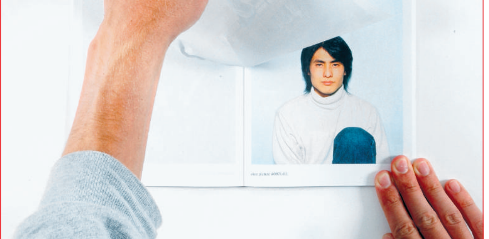
Het uitscheurbare fotoboek 'WassinkLundgren is still searching', eigen beheer, 2005

van 500 exemplaren. Vervolgens gaven ze het in de maanden na hun thuiskomst gratis weg, maar niet voordat ze er de foto's hadden uitgescheurd die hun op dat moment niet bevielen. De boekjes zijn steeds weer anders en hebben een wisselend aantal pagina's (tussen de 1 en 52). Dit conceptuele spel hebben de twee bewust in eigen handen gehouden. „Geen enkele uitgever is geïnteresseerd in een boekje dat je gratis weggeeft.”