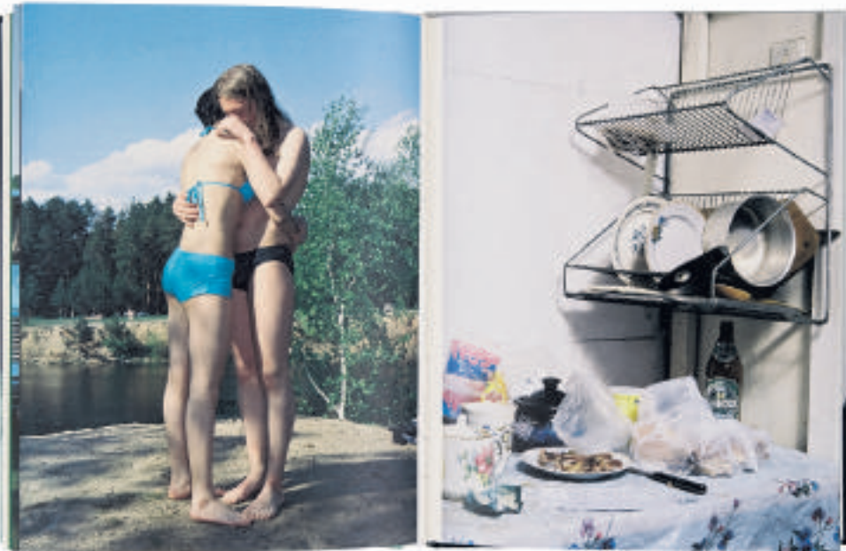
'Communism & Cowgirls' van Rob Hornstra, in 2004 in eigen beheer uitgegeven

De boeken van Wil van Iersel zijn digitaal te bekijken via de website van het Nederlands Fotomuseum: nederlandsfotomuseum.nl , werk van Michael Anhalt is te zien en te koop via www.weyong.com . Werk van de andere besproken fotografen is te zien via robhornstra.nl , nielsstomps.nl en wassinklundgren.com