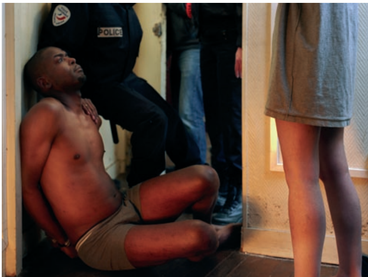
La prise , de la série "Périphéries", 2008 © Mohamed Bourouissa Collection Maison Européenne de la Photographie, Paris. Œuvre acquise grâce au soutien de la Fondation Neuflyze Vie.

Certaines œuvres permettent de compléter le parcours historique de la collection, celles d'un grand maître de la photographie couleur des années 50, comme Saul Leiter par exemple, d'autres d'interroger