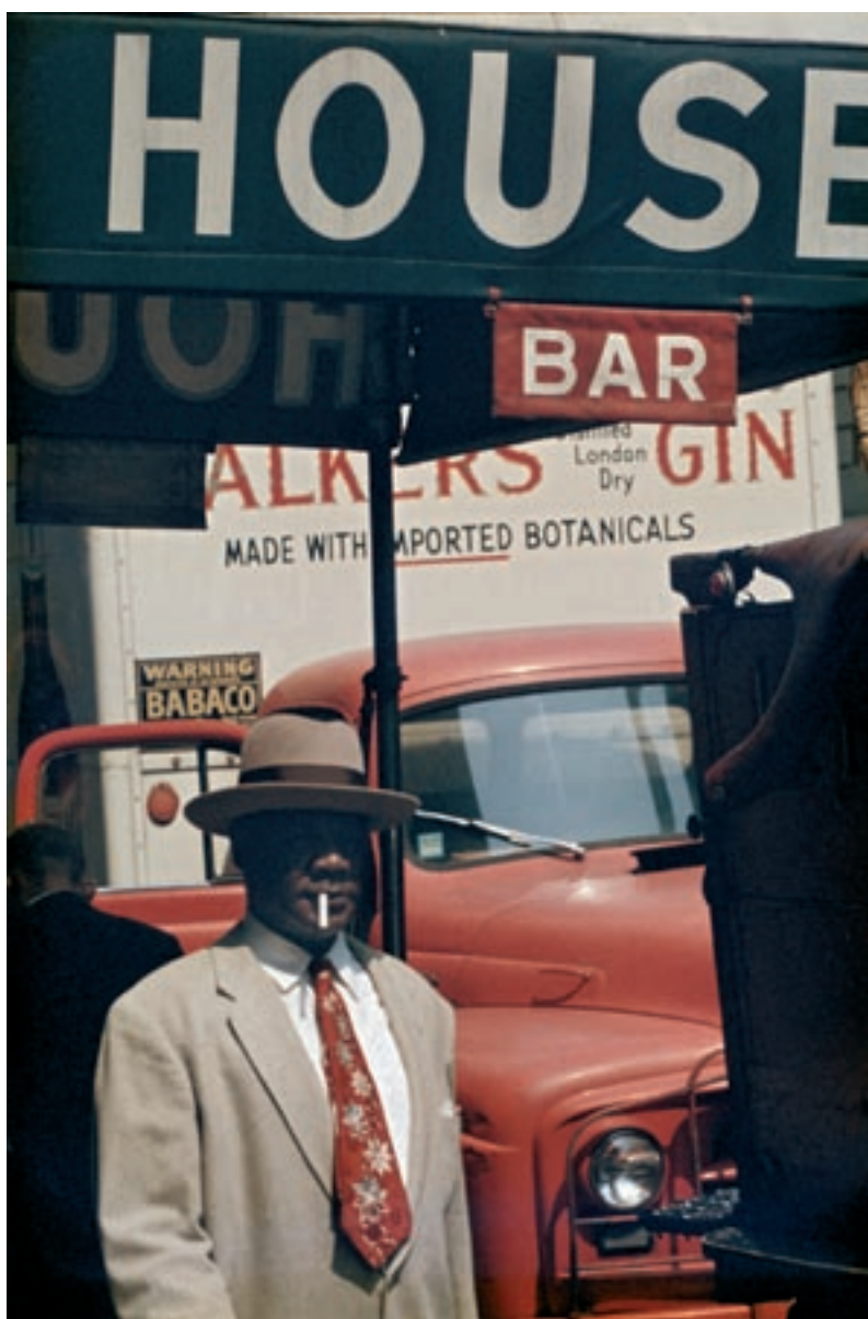
Harlem , 1960

Deux œuvres vidéos complètent cet accrochage. La première, de Marie Bovo, s'inspire d'un chant de « La Divine Comédie » de Dante ; son image d'un bouquet de lys qui se fane évoque la passion qui consume. Dans la deuxième, œuvre co-produite avec le festival le Printemps de Septembre à Toulouse, Marion Tampon-Lajariette s'inspire du mouvement de caméra d'un film d'Alfred Hitchcock, et l'applique à une vidéo d'animation représentant une étendue d'eau.